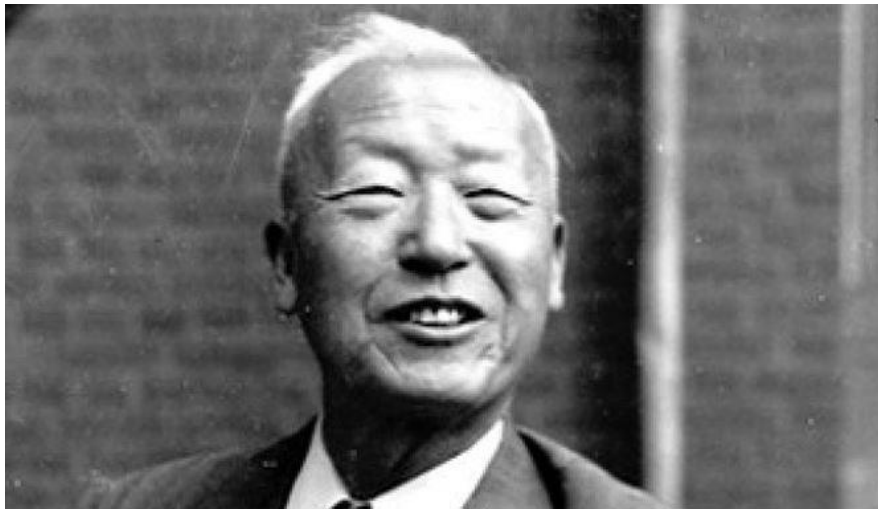
Cựu Tổng thống Syngman Rhee