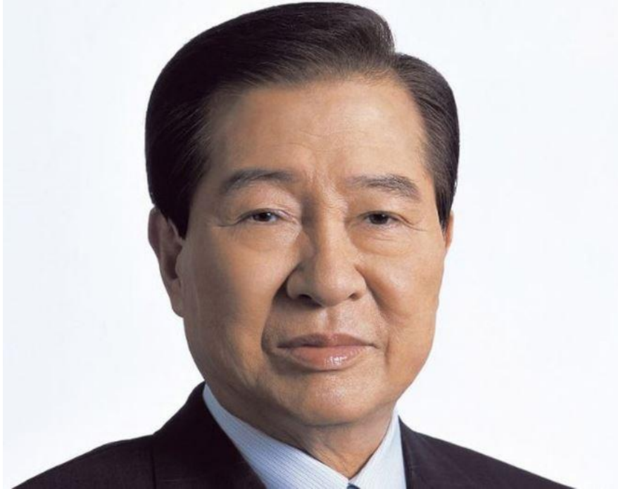
Cựu Tổng thống Kim Dae-jung

Ông Kim Dae-jung là người Hàn Quốc đầu tiên nhận giải Nobel Hòa bình vào năm 2000. Ông cũng từng tổ chức hội nghị thượng đỉnh chưa từng có với lãnh đạo Triều Tiên khi đó là ông Kim Jong Il.