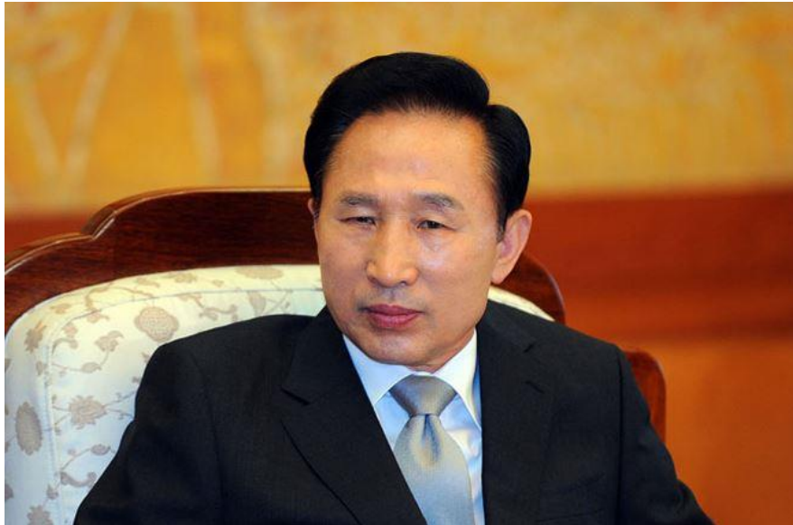
Cựu Tổng thống Lee Myung-bak

Ông Lee Myung-bak dính bê bối gian lận trước cả khi ông được bầu làm tổng thống. Mặc dù ông Lee chưa bao giờ bị truy tố nhưng ông cũng từng đứng lên xin lỗi vì bê bối tham nhũng, nhận hối lộ của anh trai, bạn thân, và gia đình của mình.