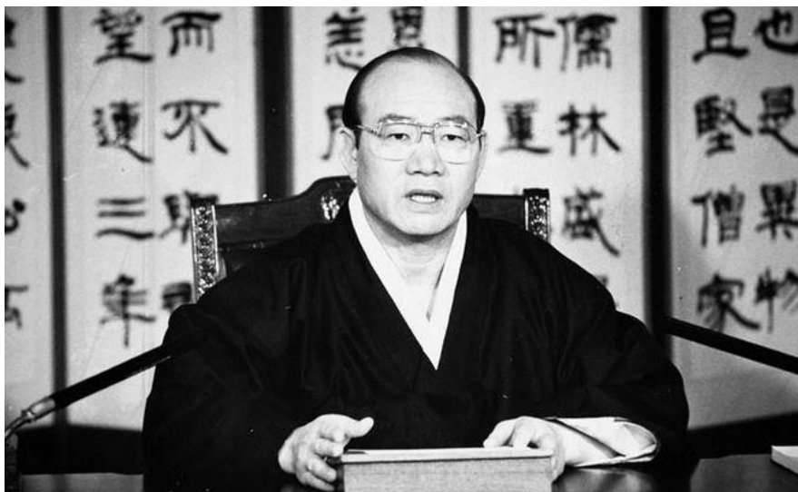
Cựu Tổng thống Chun Doo-hwan

Sau khi ông Park Chung-hee bị ám sát, Thủ tướng Hàn Quốc thời đó là Choi Kyu-ha lên làm quyền Tổng thống. Tuy nhiên, đến 7/12/1979, thiếu tướng Chung Doo-hwan tổ chức đảo chính quân sự và lên nắm quyền.