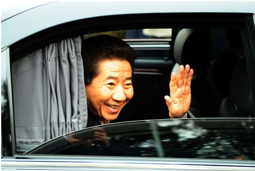
Cựu Tổng thống Roh Moo-hyun

Tổng thống Roh Moo-hyun cũng như nhiều người tiền nhiệm, danh tiếng cũng bị hoen ố vì bê bối tham nhũng của anh trai và bạn bè tể phú.