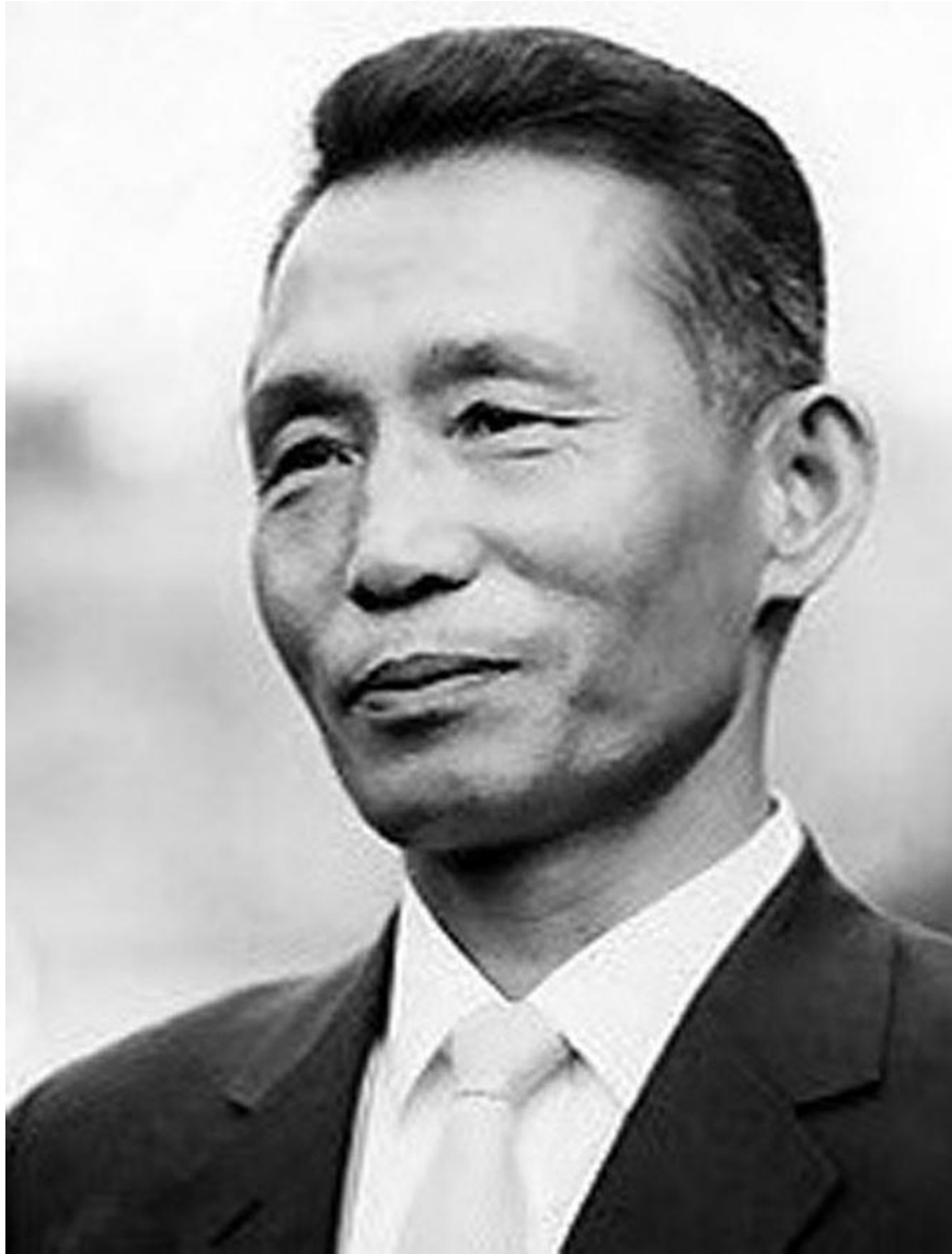
Cựu Tổng thống Park Chung-hee

Cựu Tổng thống Park Chung-hee là cha của cựu Tổng thống Park Geun-hye mới bị tòa án ra lệnh bắt giữ vì cáo buộc tham nhũng. Ông Park lên nắm quyền sau cuộc đảo chính quân sự vào ngày 19/5/1961 và trở thành Tổng thống thứ ba của Hàn Quốc vào ngày 17/12/1963.