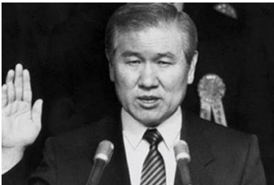
Cựu Tổng thống Roh Tae-woo

Ông Roh Tae-woo trở thành vị tổng thống được bầu cử dân chủ đầu tiên của Hàn Quốc vào tháng 2/1988. Ông được coi là người thúc đẩy tăng trưởng kinh tế thời đó và tổ chức thành công Thế vận hội Seoul 1988.