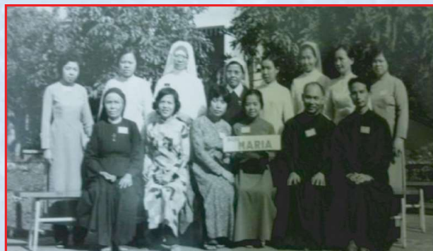
Cursillo GP Cần Thơ 1974