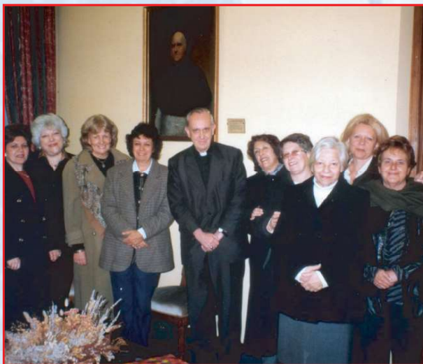
ĐGH Phanxico sinh hoạt với ACE cursillista Tổng Giáo phận Buenos Aires- Argentina, khi Ngài còn làm Hồng y

Những năm vừa qua GP Cần Thơ gửi người đi tham dự khóa ở các Giáo phận: Xuân Lộc, Phú Cường và Sài Gòn.