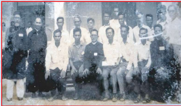
Khóa 8 Cursillo 1973