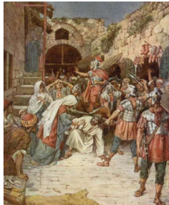
Chúa ngã vì vác thập giá.

Từ dinh Phi-la-tô đến núi Sọ chỉ xa chừng 700m. Chúa kiệt sức vì bị dày đọa suốt đêm thứ Năm, rồi bị đánh đòn nhừ tử vào buổi sáng thứ Sáu, nhưng Chúa vẫn phải tự vác lấy cây khổ giá. Lê lét, chuệnh choạng.