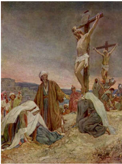
Dưới chân thập giá.

Một trong hai tên đạo tặc cũng nhạo báng Chúa: ‘Nếu ông là Con Thiên Chúa, thì hãy tự cứu mình và cứu cả chúng tôi với.’ Tên kia thì bênh Chúa: ‘Chúng ta có tội, chúng ta chịu phạt. Còn ông này có tội gì đâu.’ Sau đó hẳn thưa với Chúa: ‘khi nào Ngài về Thiên Đàng thì xin nhớ tôi với.’