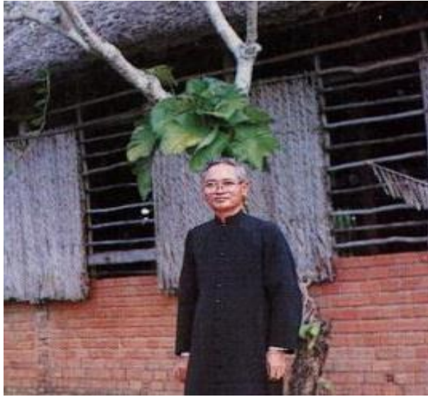
Nhà thờ Cái Rắn xưa