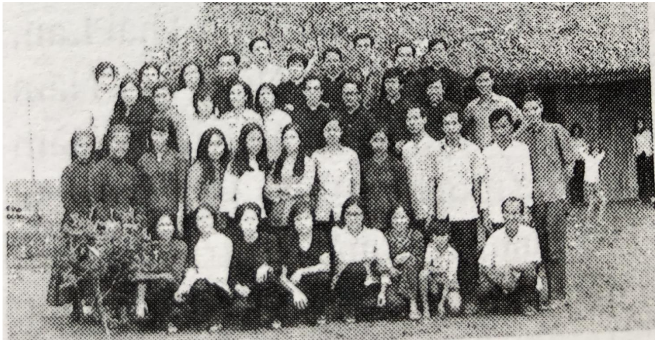
Giáo điểm Năm Căn Tháng 10.1974

Ngay từ 1971, một số giáo dân thợ mộc từ họ đạo Cà Mau, Cái Cầm ...đi theo Cha Hâu, giúp dựng lên cơ sở vật chất. Số khác, từ Họ Đạo Tắc Sậy, Cà Mau, Ao Kho...đi theo Cha, dạy học tại Giáo Điểm, Dòng Thánh Gia có mặt từ 1971, Vinh Sơn Bác Ái từ 1972, IC Tân Hiến năm 1974, Thừa Sai Việt Nam từ Lái Thiêu tới 1974, chủng sinh của địa phận từ 1971. Có hơn 40 nhân sự về Đại Hội ngày Khánh Nhật Truyền Giáo cuối tháng 10/1974 tại Năm Căn 1.