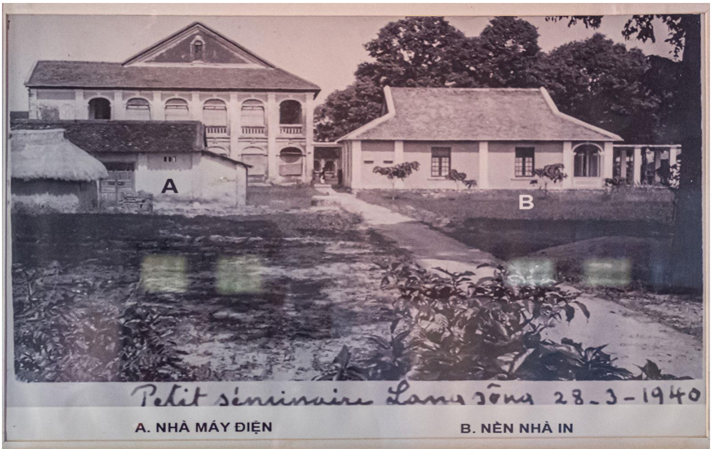
Nhà in Làng Sông khi chưa bị sụp đổ