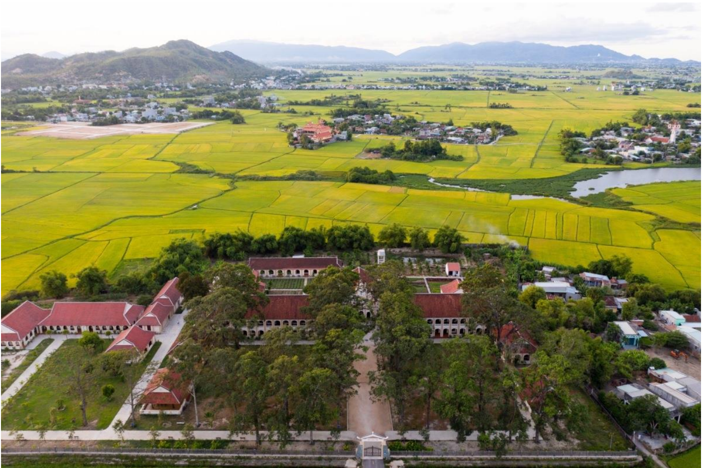
Quần thể di tích Làng Sông nằm giữa những cánh đồng lúa