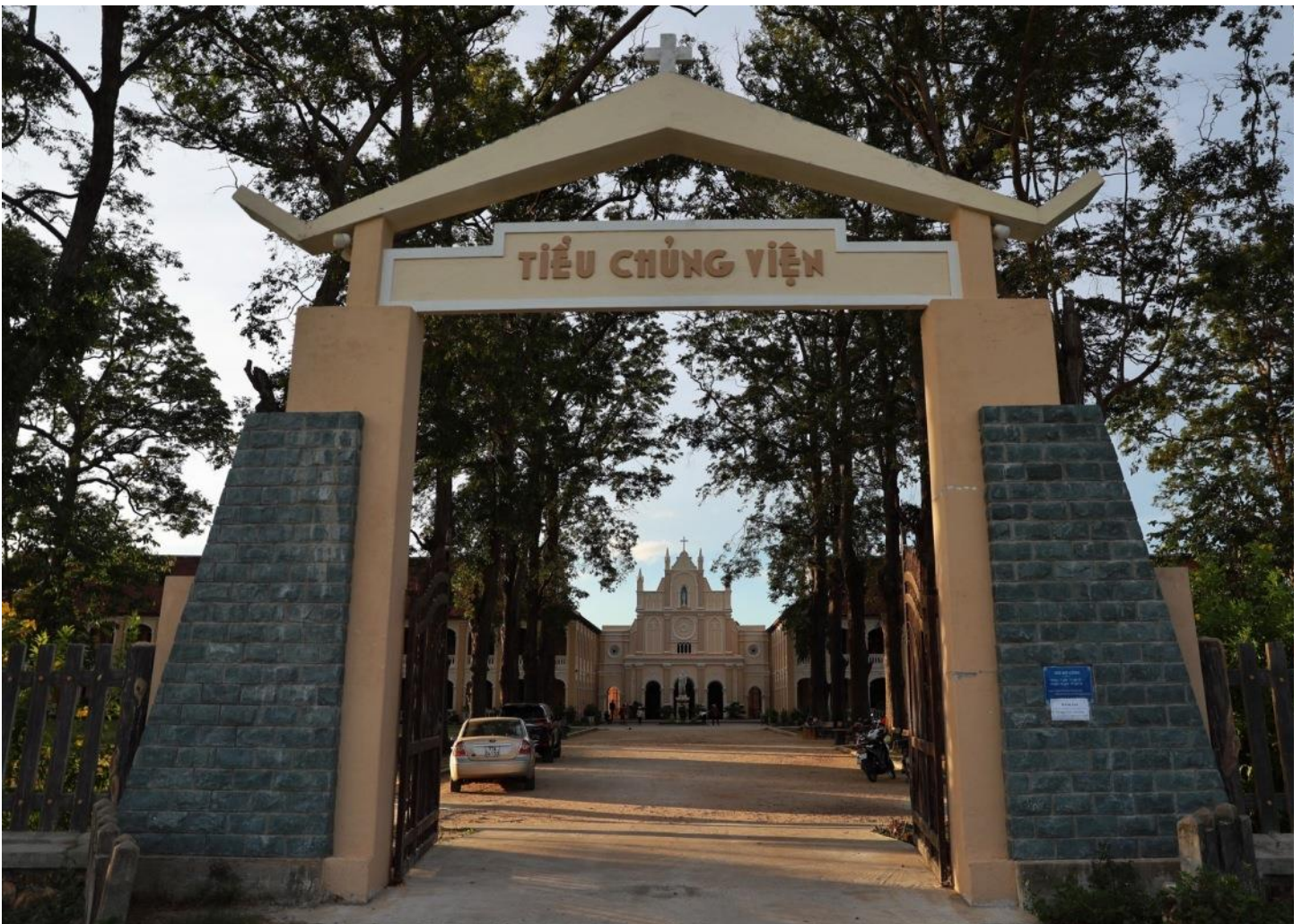
Cổng vào TCV Làng Sông xưa vẫn còn nguyên trạng đến hôm nay

Bây giờ, mời bạn đọc thăm thú đôi chút về quần thể di tích Làng Sông: Từ cổng chính nhìn thẳng mắt là nhà nguyện với kiến trúc theo lối Âu châu nằm ngay chính giữa, bên trái và phải là hai dãy nhà lầu đối xứng, xây dựng theo kiến trúc tu viện Pháp xưa rất đẹp và gần như còn nguyên vẹn, chỉ được sơn phết, bảo trì vài lần. Thẳng tắp từ cổng là hai hàng cây sao cao vút đổ bóng mát che chở cho cả khoảng sân rộng. Khuôn viên trầm mặc một màu xanh thẫm cổ thụ, xen lẫn các góc là những khu nhà lợp ngói không tường mới được phục dựng sau này theo nguyên trạng, gọi là nhà chơi, nghe đâu xưa là chỗ để các chú tiểu chủng sinh nô đùa trong giờ chơi, nếu mưa gió không thể ra sân. Tới đầu khoảng sân nhà nguyện, ngay tượng thánh Giuse, quẹo về phía tay trái đi qua một dãy hành lang sẽ gặp nhà in xưa và khu vực Tòa Giám mục cũ (đã dời về Qui Nhơn như hiện nay từ năm 1936 hiện là nơi ở của các cha hưu dưỡng giáo phận - NV). Đây là hai mảng công trình mới được phục dựng lại sau này, vì đã bị bom đạn san bằng nhiều chục năm trước.