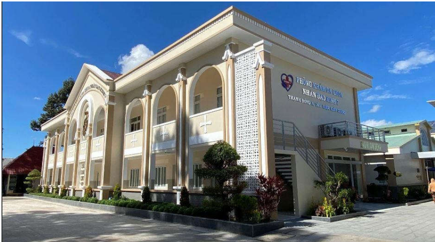
Bệnh viện Đa khoa Nhân đạo Kinh 7

Lời ca này, bài ca ấy vẫn còn vang vọng trong tim những người biết chạnh lòng, như ánh lửa tri ân thấp từ Cây-Nến-Vĩ-Đại-Giêsu mãi vươn xa lan rộng, vượt mọi ranh giới vách ngăn để chia lửa yêu thương vào trong nhiều tâm hồn hướng về chốn vô biên thênh thang quê Trời hạnh phúc. †